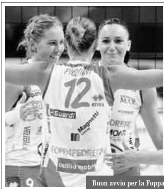
Buon avvio per la Foppa